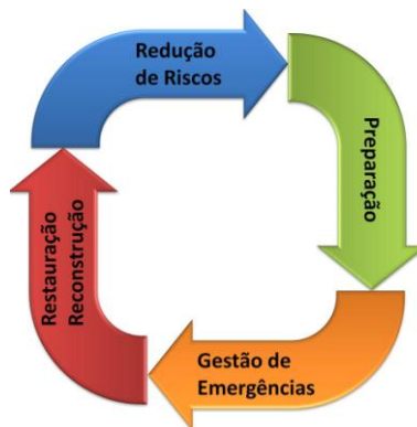
Fig. 1. Ciclo da Gestão de Desastres Naturais

A Gestão de Desastres Naturais, também denominada Gestão de Emergências, é a atividade de prevenir e lidar com riscos [7]. O ciclo de vida da Gestão de Desastres Naturais, segundo [8], apresenta quatro fases: (i) redução de riscos; (ii) preparação; (iii) gestão de emergências; (iv) restauração e reconstrução (Figura 1). Outras denominações para essas quatro fases são: (i) mitigação; (ii) prontidão; (iii) resposta; e (iv) recuperação [7].