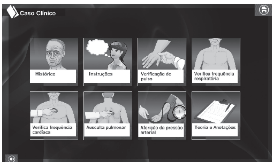
Figura 1: Tela inicial do objeto digital de aprendizagem “Sinais Vitais e Anatomia”.

O sistema multimídia construído para WEB apresenta nível de interatividade plena com simulação construída por meio de cenários e personagens em animação bidimensional (2D).