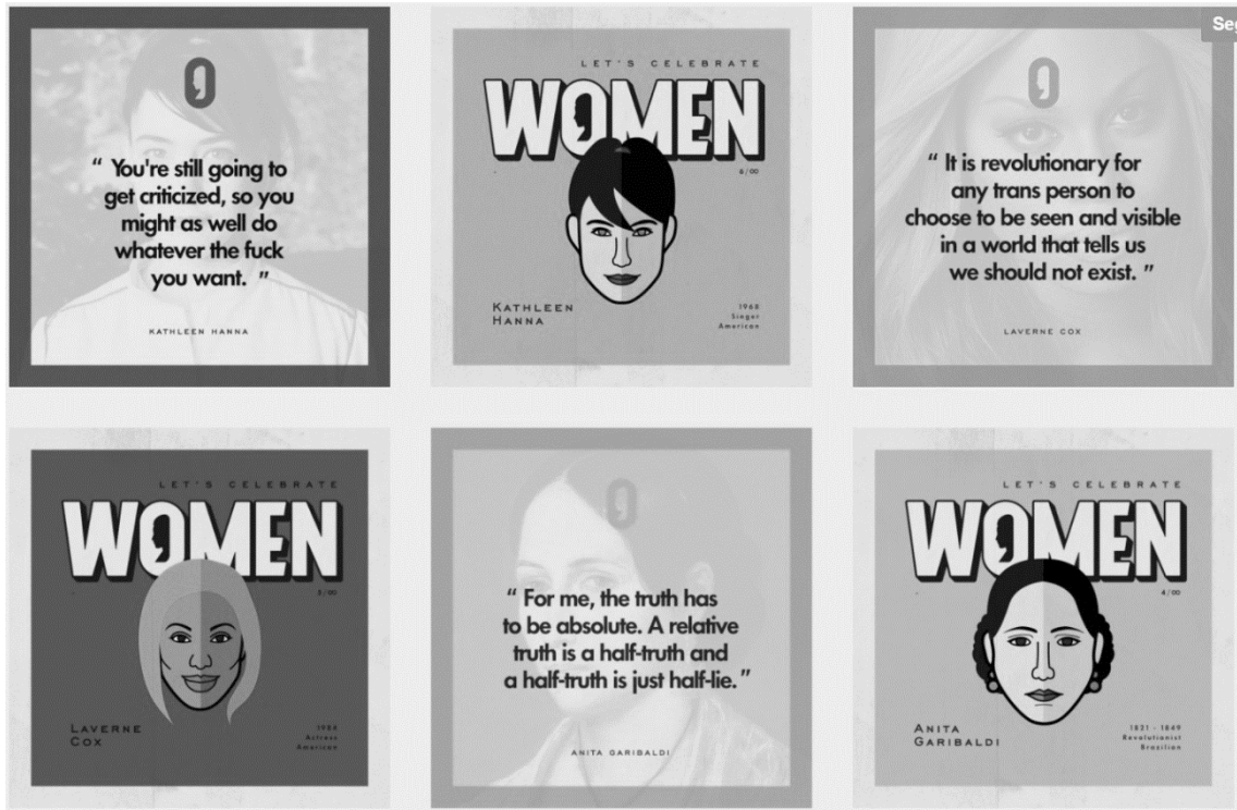
Figura 8 – No Tumblr de Let's Celebrate Women , clicar em uma das imagens leva o usuário ao texto com a biografia correspondente, em inglês, e a links com mais informações 11 .

Por sua vez, o Tumblr de Let's Celebrate Women apresenta, em sua página inicial, todas as imagens dispostas lado a lado (Figura 8). Clicar em uma delas leva o usuário ao texto correspondente. Assim, verifica-se, novamente, a estratégia de combinar imagens, textos e links para produzir um conteúdo atrativo.