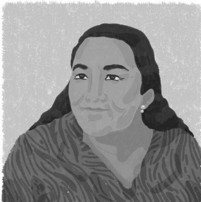
MARGARIDA ALVES (Alagoa Grande, Brasil, 1943 - Alagoa Grande, Brasil, 1983)

Figura 1 – A ilustração da líder sindical brasileira Margarida Alves em Aurélia . Abaixo do desenho há um resumo de sua biografia e links para outros sites que possuem mais informações sobre sua trajetória 2